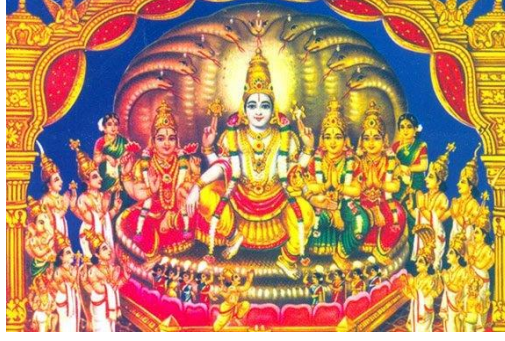
శ్రీ పరమపద నాథః

శ్రీమతే రామానుజాయ నమః. శ్రీ రామానుజాచార్య గురవే నమః. శ్రీ రంగనాథ పరబ్రహ్మణే నమః.