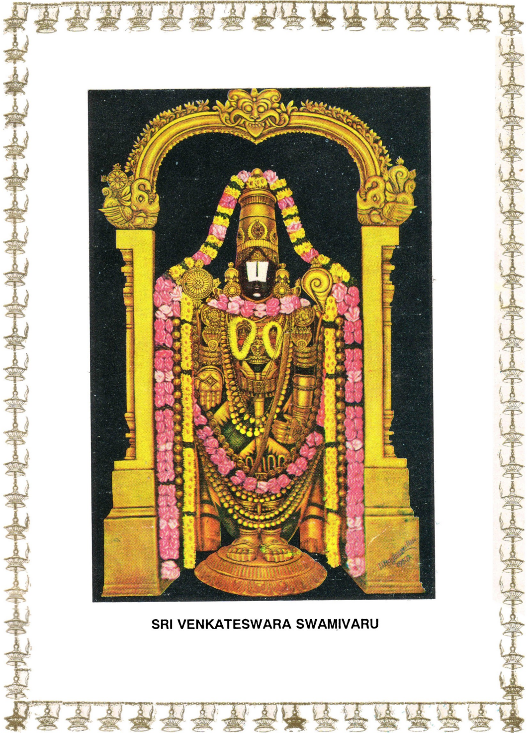
SRI VENKATESWARA SWAMIVARU